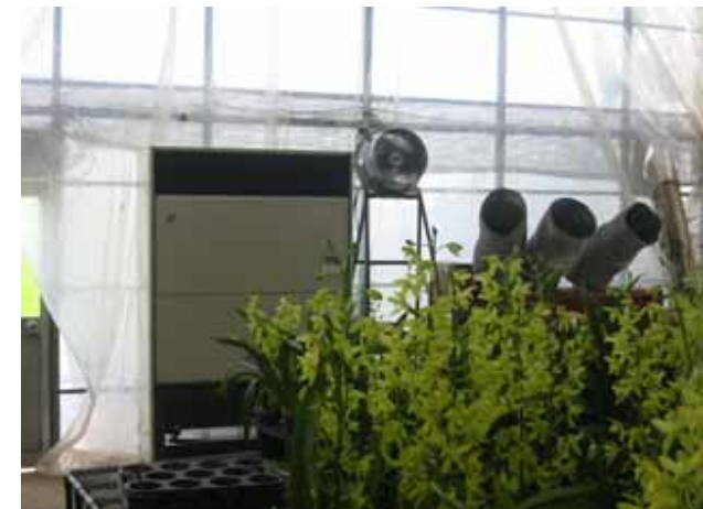
【出荷調整棟のエアコン設置状況】