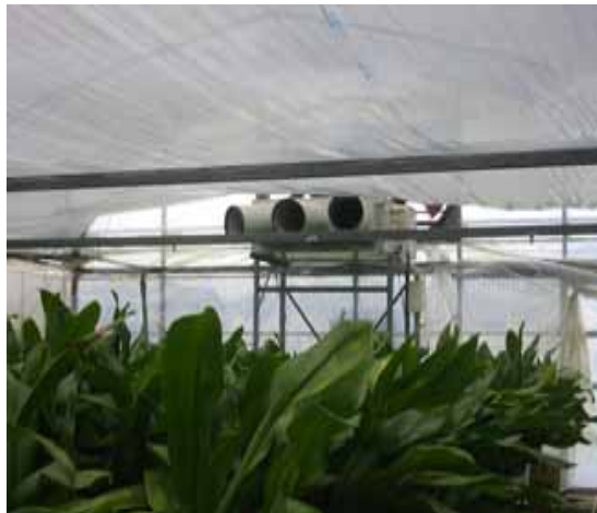
【育苗棟内部のエアコン設置状況】