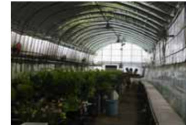
【出荷調整棟の内部の様子】

【開花・出荷調整棟の場合】 規模: 85坪 (280㎡) 設定温度: 22～25℃前後 (最低18℃以上) 冷房期間: 5月～9月 導入機種: SZVP224A × 1台 1層被覆(天面遮光シートあり)