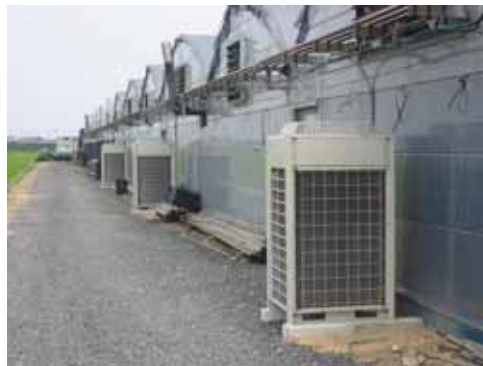
【育苗棟の室外機設置状況】